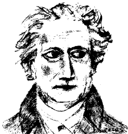
Johann Wolfgang von Goethe (S. 184).

Mai 2012 · Seite 151 – 192 · 38. Jahrgang