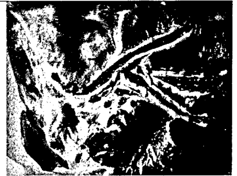
Cholangitis durch Befall mit Fasciola hepatica .