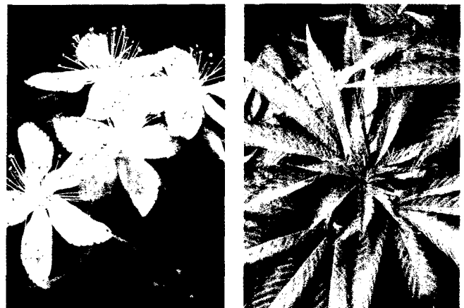
Im Mittelpunkt der diesjährigen Schweizerischen Jahrestagung für Phytotherapie standen psychotrope Drogen.