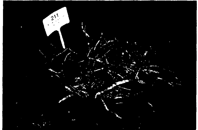
Die TCM-Droge Astragalus membranaceus gibt es in Bayern aus kontrolliertem Anbau.

Titelthemen finden Sie unter den roten Seitenangaben.