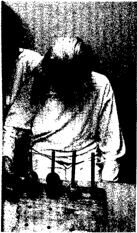
Der Cholinesterasehemmer Donepezil wirkte sich auch bei fortgeschrittener Alzheimer-Erkrankung positiv auf die Funktionsfähigkeit und Kognition der Patienten aus (s. dieses Heft S. 823).