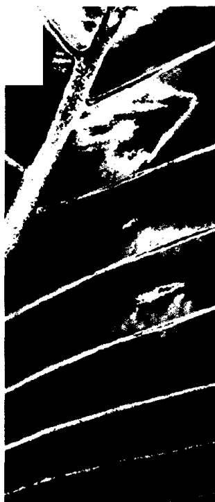
Titelbildvorlage: Symbolbild.