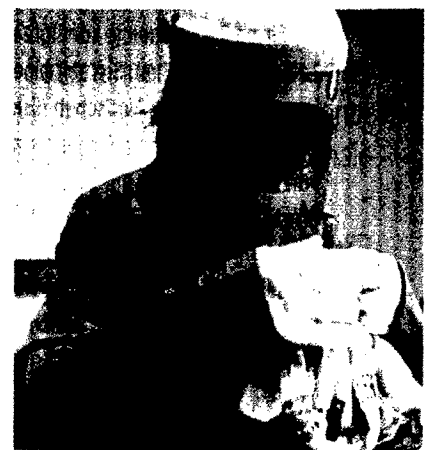
Alt-Sein auf Probe