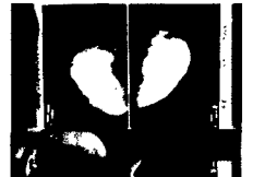
Nachsorge des Mammakarzinoms Seite 21