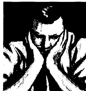
18_Fatigue nach abgeschlossener Prostatakrebstherapie