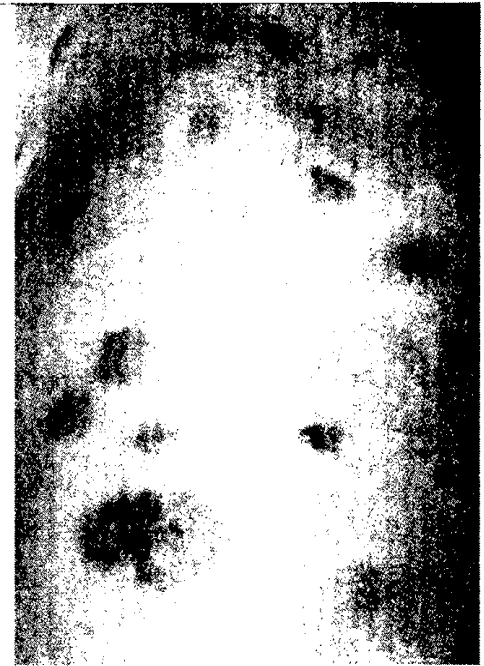
Makulopapulöse, teils noduläre kutane Mastozytose mit Blasenbildung ▶ Seite 24