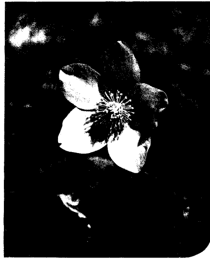
Titelfoto: Christrose (Helleborus niger)