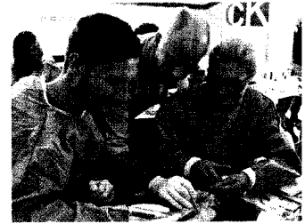
Gelungener Mix aus Theorie und Praxis