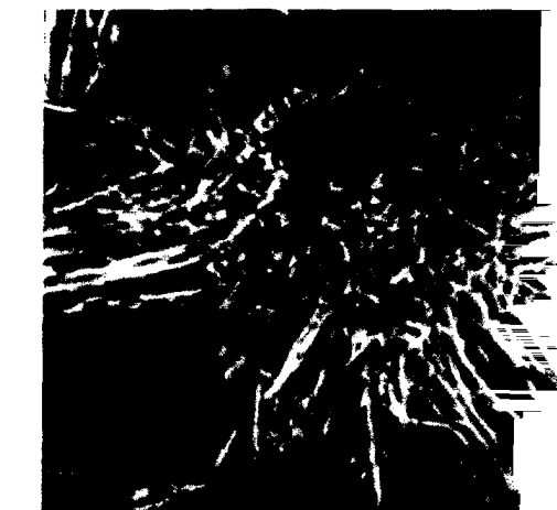
Titelbild: Nierenkrebszellen (Falschfarbendarstellung).