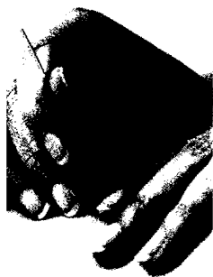
Akupunktur hilft bei chronischen Schmerzen (s. dieses Heft S. 2409).