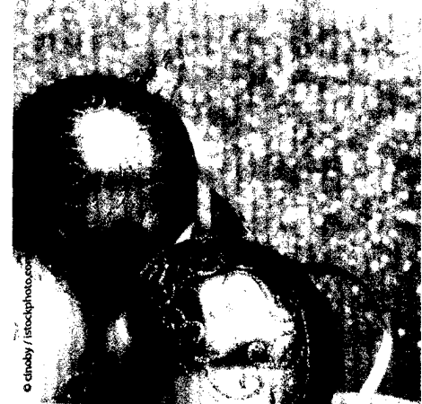
Titelbild: aus dem Beitrag von F.-P. Pfabe, Seite 517–524

Ihr Redaktionsteam Fachzeitschriften Springer Medizin