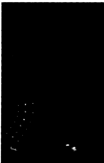
Beispiel einer parametrischen Strainanalyse bei einer Patientin mit pulmonaler Hypertonie bei fehlmündender Lungenvene. ▶ Seite 474