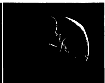
Aurora Thoms-Mozes – Beryllium muriaticum