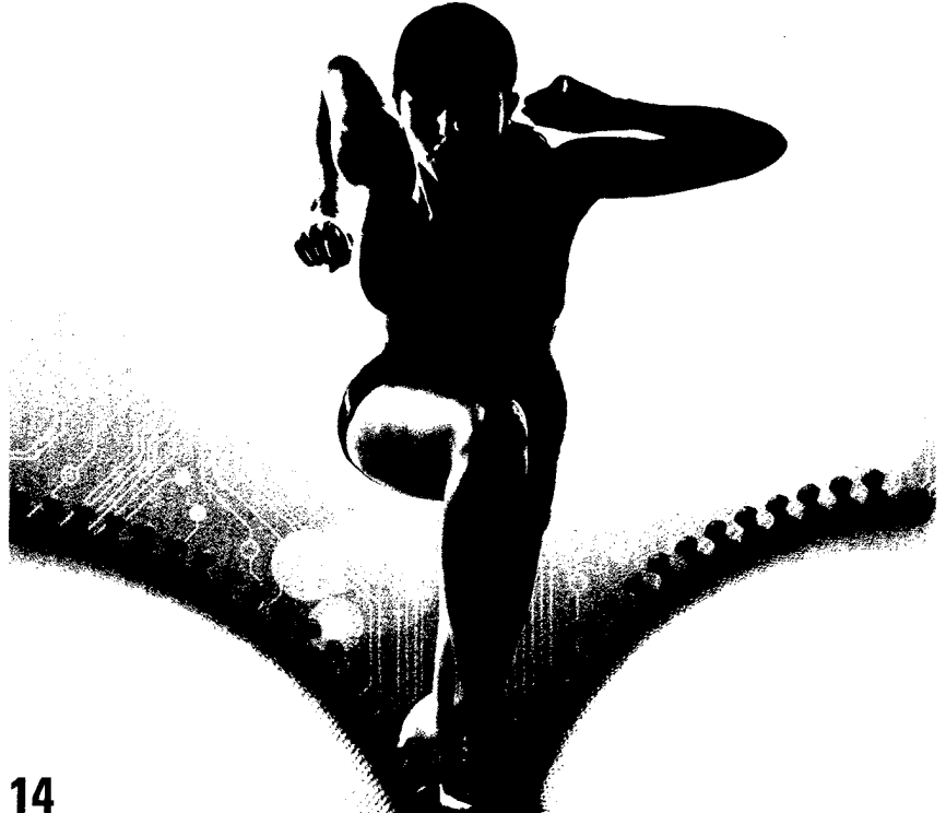
14 Intelligente Textilien bieten eine enorme Anwendungsvielfalt. Im Gesundheitsbereich kommen sie verstärkt zum Einsatz und sind auch für die Telemedizin interessant.