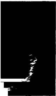
Was sehen Sie? (s. Mediquiz S. 2097).