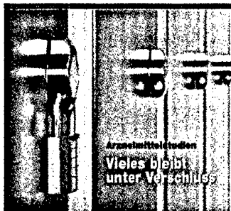
Neuere: Überfischung der Erkrankungsgröße trotz Meldepflicht. Das ist Gesundheitsentwicklung: Frauen haben ein Recht auf Unverwundtheit. Seite 10