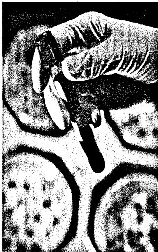
Hilft ein neues 4-Kallikrein-Modell bei der Entscheidung: Prostatabiopsie, ja oder nein? (S. 5)