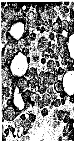
Promyelozytenmark als typischer Knochenmarkbefund bei Agranulozytose (s. dieses Heft S. 366).