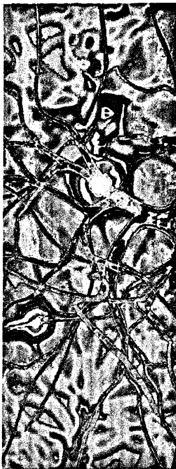
Titelbildvorlage: Symbolbild.