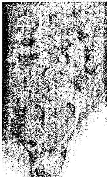
Was sehen Sie? (s. Mediquiz S. 369).