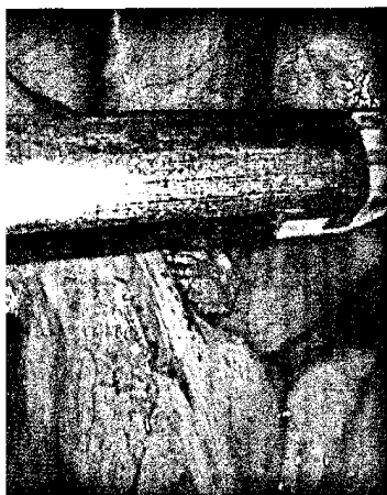
Ist der Appendixstumpfverschluss mit dem Stapler bei der laparoskopischen Appendektomie von Vorteil?