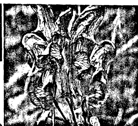
Bernd Müller-Thederan – Interview