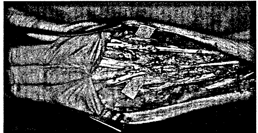
Rupturen Strecksehnen III–V bei Caput-ulnae-Syndrom. ► S. 256