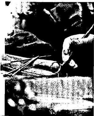
postpartale Blutung – = vorgehen?