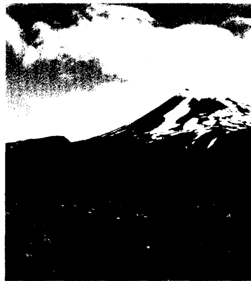
Ein Auslandsaufenthalt, zum Beispiel im Rahmen des PJ, erweitert in vielen Belangen den Horizont. Ein Erfahrungsbericht aus Chile. Seite 56