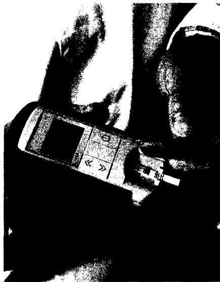
Teststreifen für Typ-2-Diabetiker ohne Insulintherapie sollen nicht mehr erstattet werden. Apothekern drohen Umsatzeinbußen. Seite 44