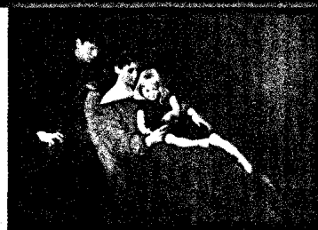
George de Forest Brush „A Family Group“ (1907)

Bildbetrachtung auf Seite 486 dieser Ausgabe