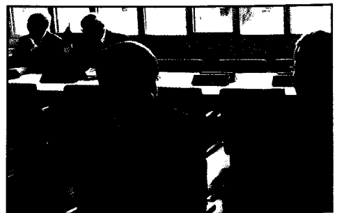
BVRD-Vertreter für Kompetenzer- weiterung für RettAss in Hessen