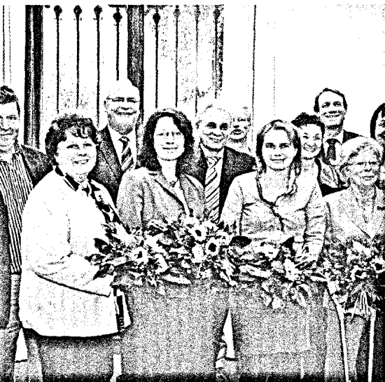
Der DAV hat Kooperationen zwischen Apotheken und Selbsthilfegruppen ausgezeichnet. In Berlin wurden die Preise verliehen. Seite 6