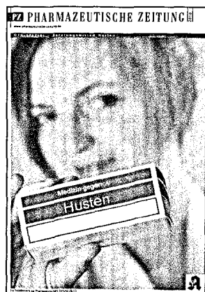
Die PZ wird sich in Zukunft intensiver mit Selbstmedikations-Arzneimitteln beschäftigen. Vier redaktionelle Beilagen pro Jahr sollen das pharmazeutische Personal bei der Beratung unterstützen. Den Anfang macht, passend zur Jahreszeit, das Heft »OTC-Spezial – Beratungswissen Husten«.