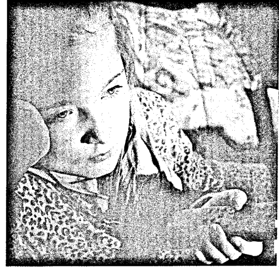
Millionen von Kindern in Deutschland leben in Armut. Vielen von ihnen mangelt es an Bildung, Förderung und sozialer Teilhabe. Seite 56