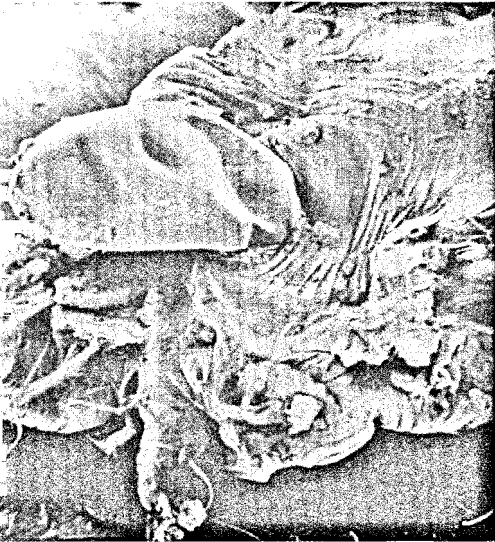
Die Krätze ist in Deutschland zwar selten, aber nicht ausgerottet. Wie erkennt und behandelt man die Milbeninfektion? Seite 38