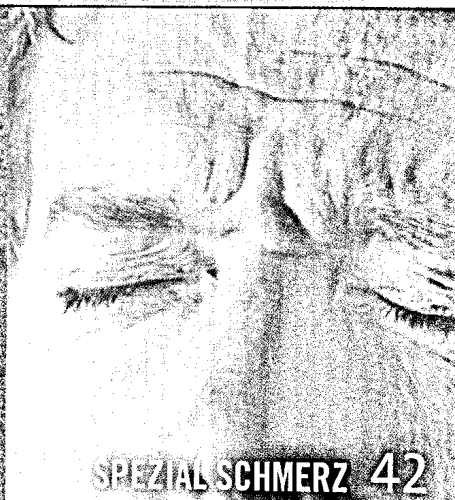
SPEZIAL SCHMERZ 42