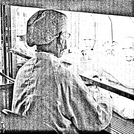
Die AOK Berlin-Brandenburg hat die Versorgung ihrer Versicherten mit parenteralen Zytostatikarezepturen ausgeschrieben. Seite 6