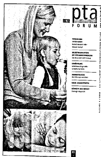
In dieser Ausgabe finden Sie das Supplement PTA-Forum 1/2010.