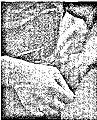
Handekzeme können durch das Tragen von Latexhandschuhen entstehen (S. 292).