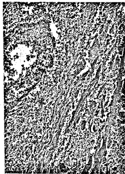
Nekrotisierende Vaskulitis (Seite 1715).

64-year-old patient with efflorescences at both legs J. P. Borde, W. B. Offensperger