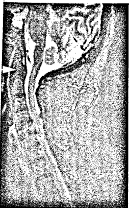
Magnetresonanztomographie der Halswirbelsäule: Knochenmarködem des Atlantoaxialgelenkes (Seite 1730).