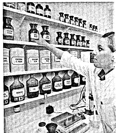
Vor der Herstellung einer Rezeptur ist eine Verordnung auf galenische Plausibilität zu prüfen. Was gilt es dabei zu berücksichtigen? Seite 22