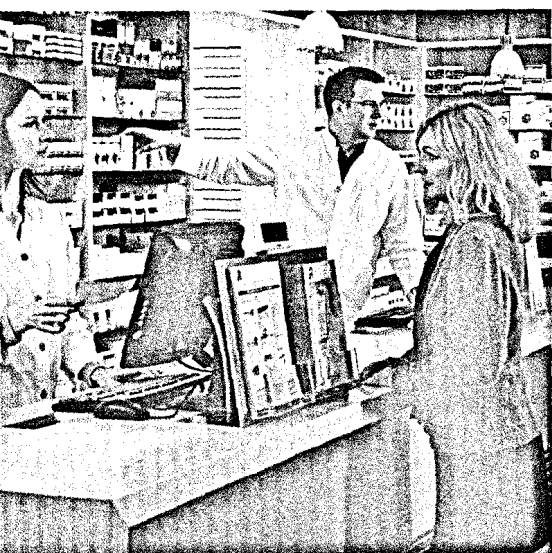
Das Beratungsgespräch in der Apotheke ist sehr wichtig. Muss die Qualität dieser Beratung regelmäßig geprüft werden? Seite 6