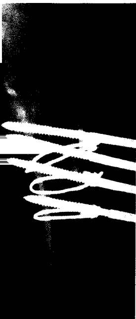
Periprothetische Femurfraktur Typ Jensen 3 bei infizierter Hüft-Totalendoprothese. (s. Seite 1539).