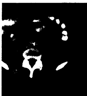
Was sehen Sie? (s. Mediquiz S. 1547).