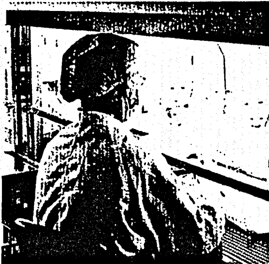
Die AOK Berlin-Brandenburg hat die Versorgung ihrer Versicherten mit parenteralen Zytostatikarezepturen ausgeschrieben. Seite 6