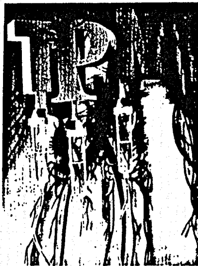
Wenn die Zufuhr über den Magen-Darm-Trakt nicht mehr möglich ist, bietet die parenterale Ernährung einen Ausweg. Seite 16