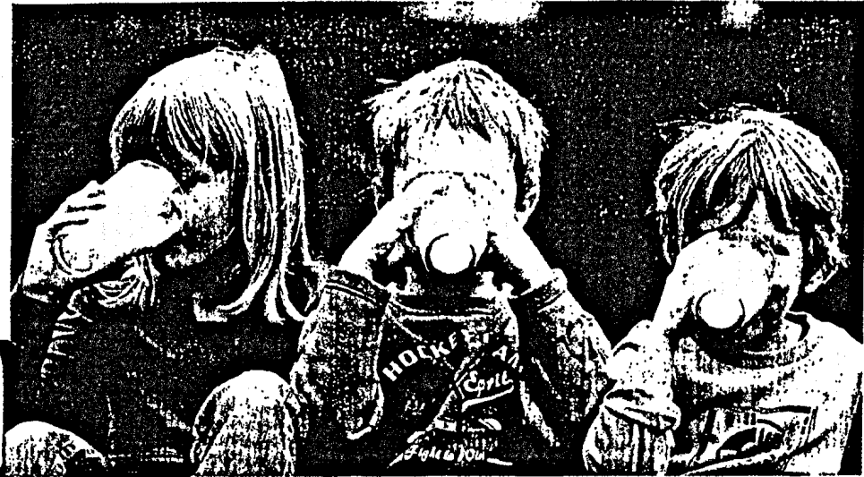
Bei einer Allergie gegen Nahrungsmittel fällt eine ausgewogene Ernährung nicht leicht. Es gilt, das Allergen zu meiden, sich im Kennzeichnungsdschungel zurechtzufinden und Mangelerscheinungen vorzubeugen. Seite 34