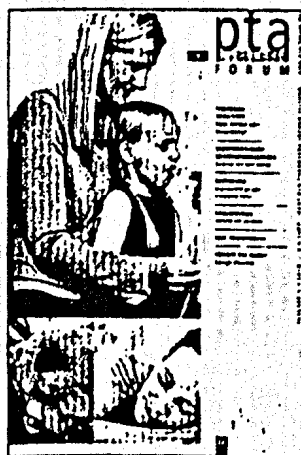
In dieser Ausgabe finden Sie das Supplement PTA-Forum 1/2010.