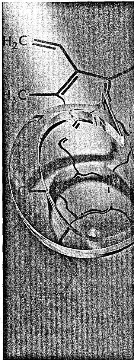
Titel ..... 20 Gasotransmitter Paradoxon Kohlenmonoxid