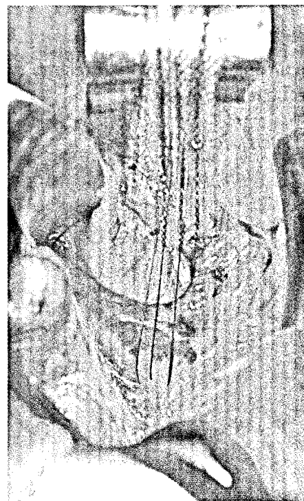
Verankerung des Polypropylenmeshes am Lig. longitudinale anterius. Lesen Sie mehr zur Therapie von Belastungsinkontinenz und Deszensus ► ab S. 653