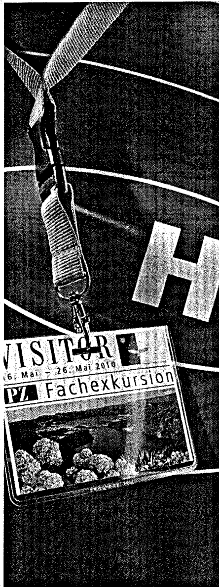
Titel ..... 18