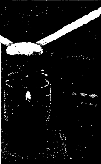
Traumatische Erlebnisse wie das Unglück in Duisburg hinterlassen seelische Wunden, die nur schwer zu heilen sind. Seite 36