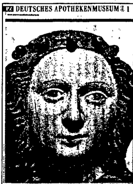
In dieser Ausgabe finden Sie das Supplement Deutsches Apothekenmuseum 1/2010.

Marktkompass 48 / Forum 56 / Personalien 69 / Kalender 74 / Impressum 82 / Stellenmarkt 83 / PZ-Markt 93 /