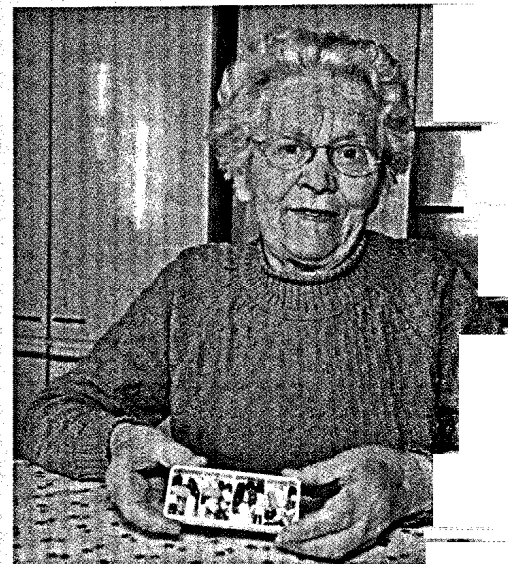
Einige Arzneistoffe sind für ältere Menschen potenziell risikoreich und ungeeignet. Die Priscus-Liste nennt mehr als 80 davon. Seite 28