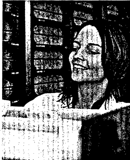
Nicht nur im Sommer sind Personalvermittlungsagenturen für Apotheken gefragt. Sie helfen, eine Urlaubsvertretung zu organisieren. Seite 42