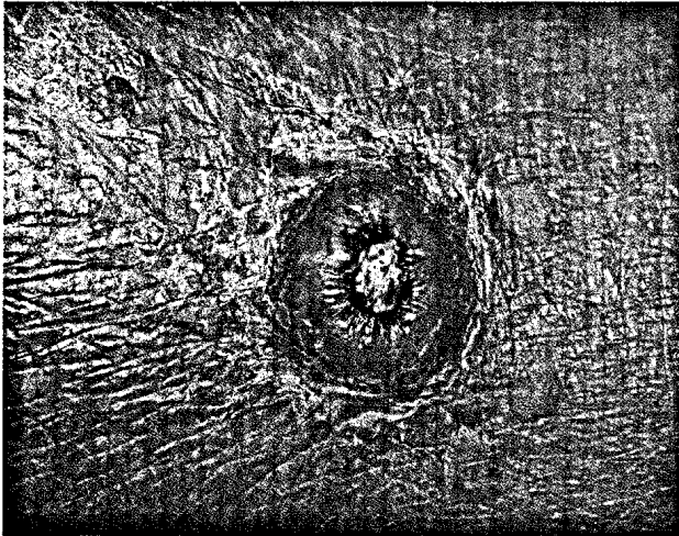
14 Typischerweise kraterförmig ragt das mal benigne, mal maligne Keratoakanthom über dem Hautniveau auf.