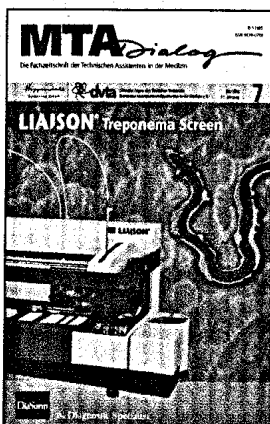
Titelbild: Diasorin, Treponema pallidum Titelstory S. 590