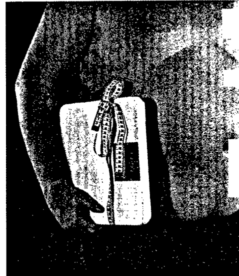
Zum Auftakt der neuen Serie »Arzneistoffe vor der Zulassung« nimmt die PZ den Appetitzügler Lorcaserin unter die Lupe. Seite 20