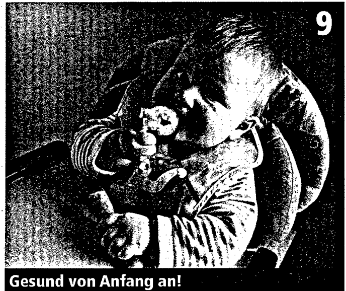
Gesund von Anfang an!