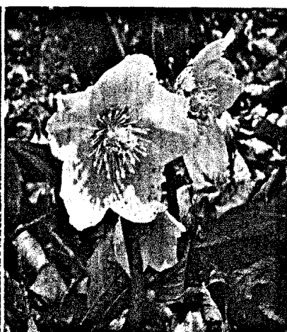
Ira Tucker – Helleborus niger