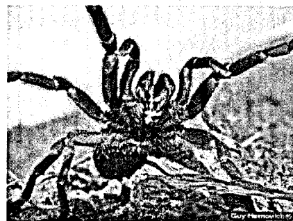
Israelische schwarze Tarantel in Drohhaltung