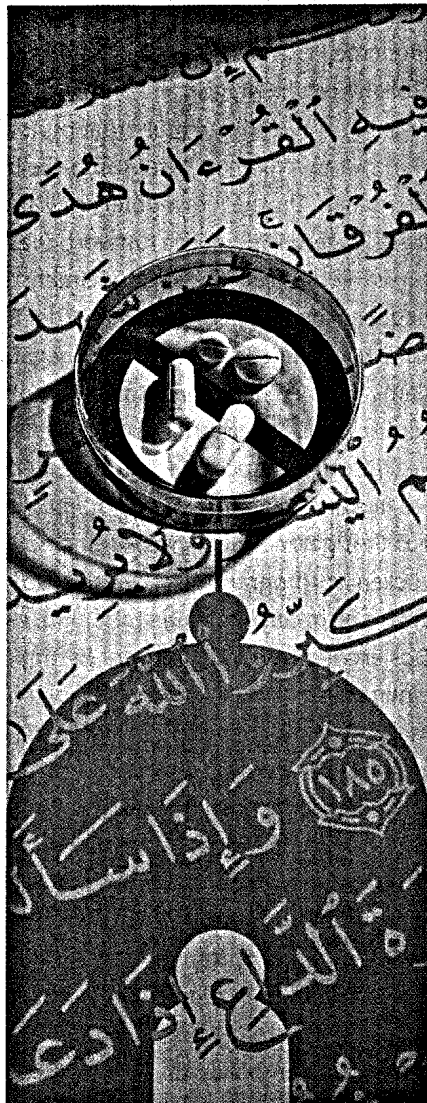
Titel ..... 14 Islamischer Fastenmonat Arzneimittel im Ramadan