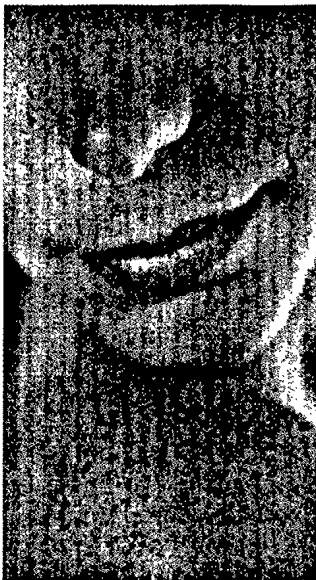
Melanozytäre Naevi finden sich nicht nur an den offensichtlichen Körperstellen (S. 248).