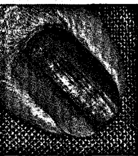
Malignes Melanom der Nagelmatrix am rechten Kleinfinger (s. Seite 1432).