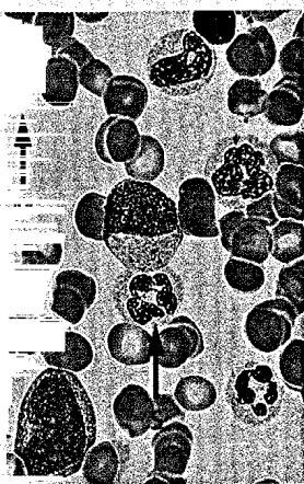
Blutbild einer chronischen myeloischen Leukämie.