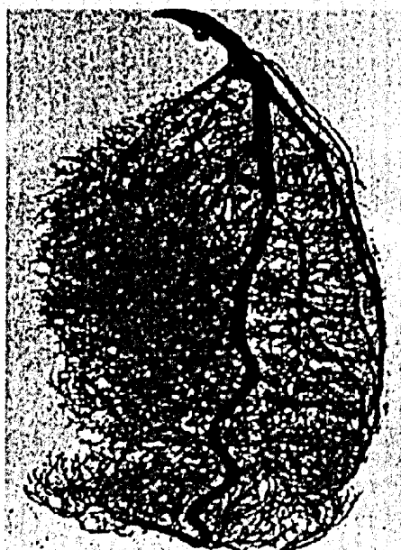
Koronargefäße bei Hochdruckherz: mit Stenosen muss gerechnet werden ► Seite 815