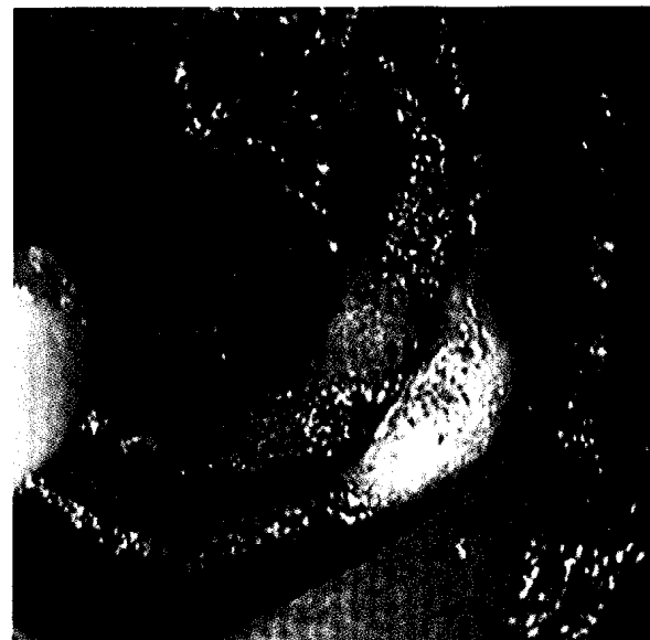
Ist die Pushenteroskopie nach State-of-the-Art? ► Seite 711

New therapeutic approaches to special diseases of the small intestine M. Schumann · K. Herrlinger · M. Zeitz · E.F. Stange