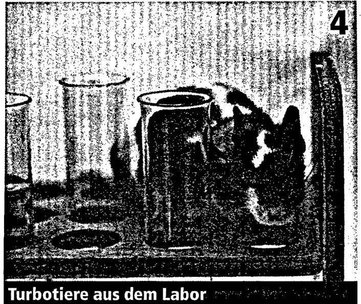
Turbotiere aus dem Labor