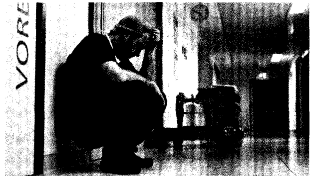
Ärzte und ganz besonders Anästhesisten weisen im Vergleich zur Allgemeinbevölkerung eine erhöhte Suizidalität auf.

Every life counts. Suicide by anesthetists B. Mäulen